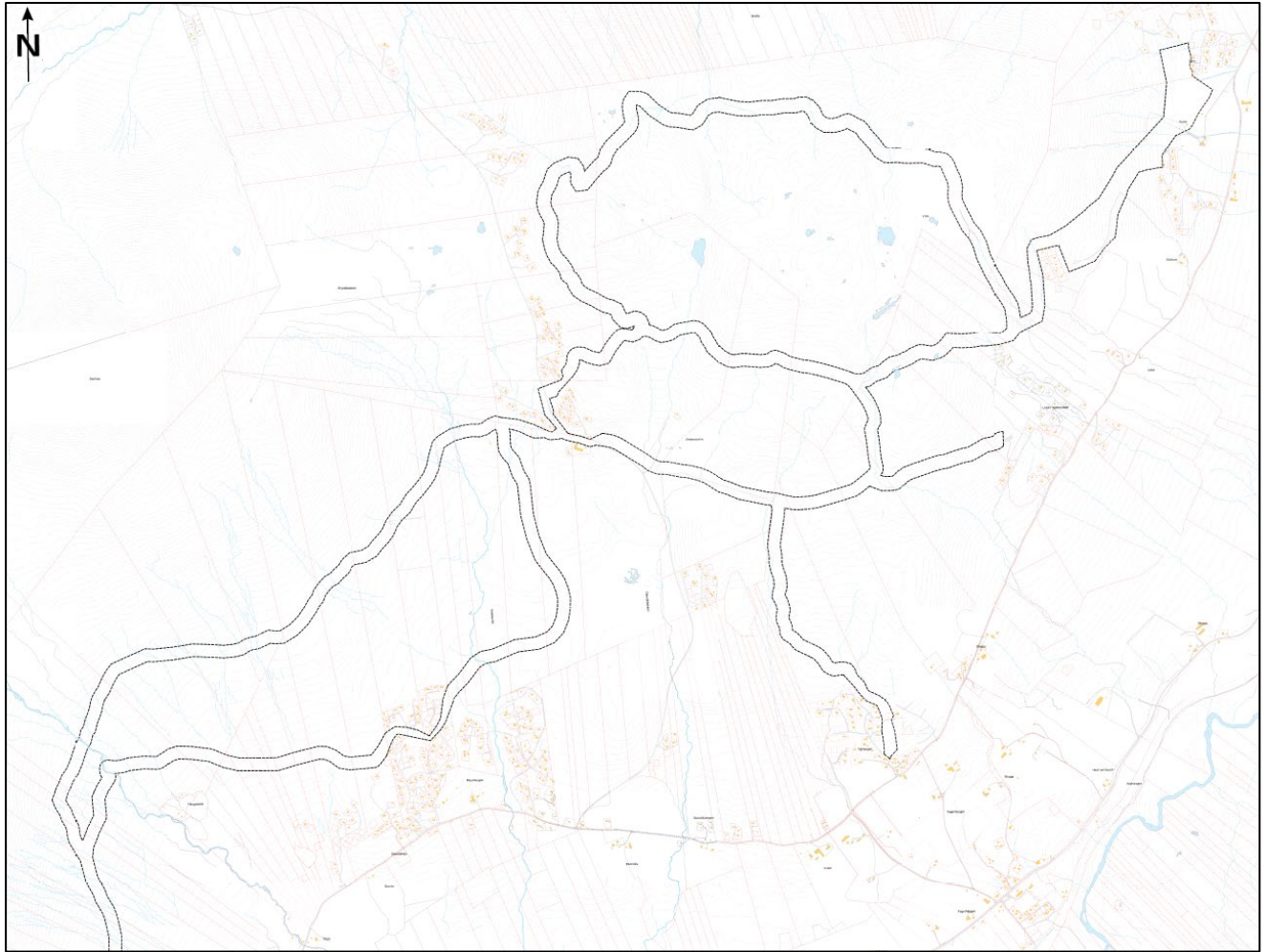
Illustrasjon over nordre del av planområdet.