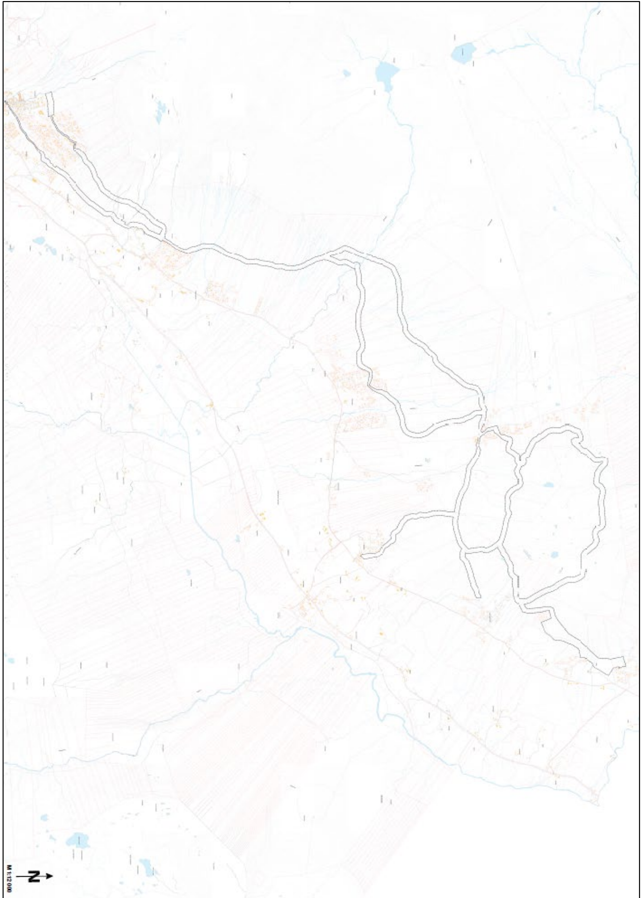
Illustrasjon over hele planområdet. Se også www.oppdal.kommune.no for PDF.