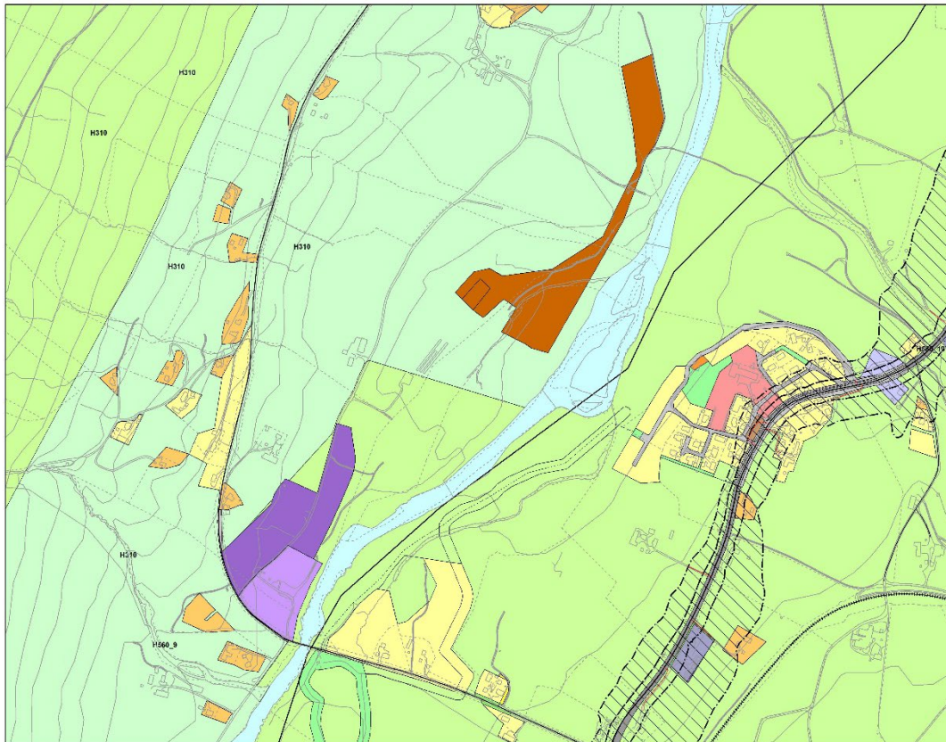
Figur 2 . Kartutsnitt som viser utvidelse av næringsområde for Fjellmat og Fjellfisk, og område for Andre typer bebyggelse og anlegg.

I forbindelse med utredning av konsekvenser for miljø og samfunn, viser vi til utredningen som følger detaljreguleringsplanforslaget planID 2016012.